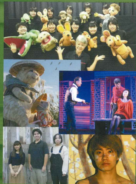
第40回記念Kyoto演劇フェスティバル いよいよ開幕!

KYOTO PREFECTURAL CENTER FOR ARTS AND CULTURE